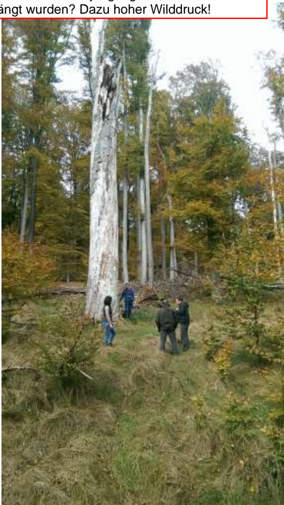
Abb. 2: Sommersturmlücke im Naturwaldreservat Brunnstube, wie sie in der Regel nur im Altbuchenwald auftreten kann.

Wo kommt die Ei-Verjüngung her, wenn die Alt-Ei verdrängt wurden? Dazu hoher Wilddruck!